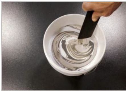
Fase 3 - Miscelare bene il prodotto