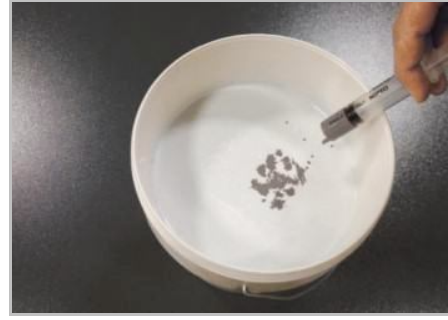
Fase 2 - Colorare Minimal se necessario