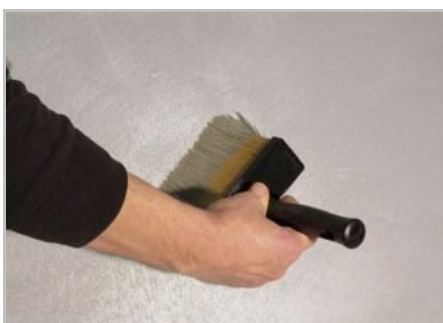
Fase 5 - Dopo alcuni minuti accarezzare il prodotto con il pennello scarico se desiderate uniformare il disegno