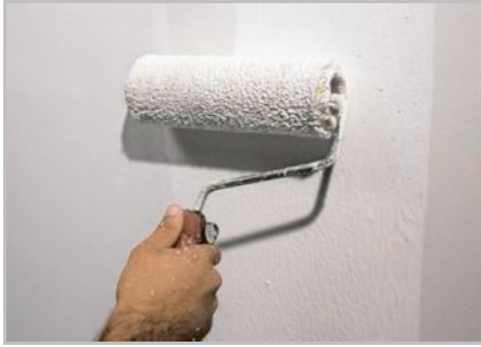
Fase 1 - Applicazione Primus Sabbia

Conservare in luogo fresco e asciutto al riparo dall'umidità e dal gelo.