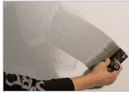
Fase 4 - Distribuire il prodotto liberamente